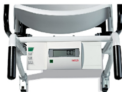
Plate-forme de pesage

Facilement transportable grâce à ses roulettes Adapté pour le pesage des résidents directement sur leur fauteuil roulant